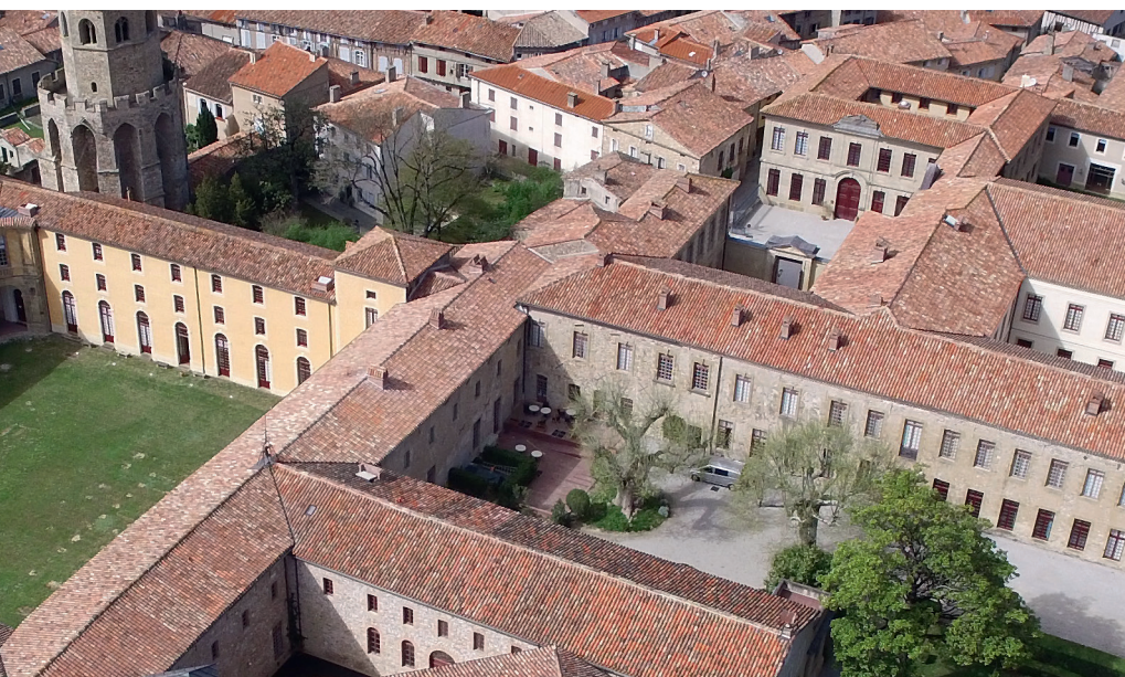
Vue aérienne Abbaye-école de Sorèze

L'outil numérique « Wisembly » a été utilisé pour permettre aux membres de l'ADT de proposer des thèmes prioritaires à approfondir en 2019 dans le cadre d'un travail relatif à la démarche prospective régionale ainsi que pour interpeller directement la Présidente en plénière.